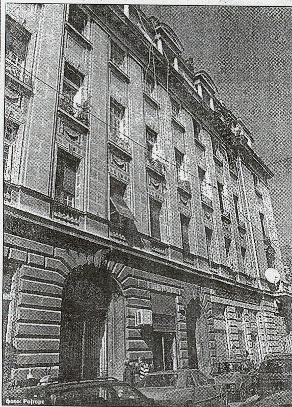
Зграда Спасићеве задужбине